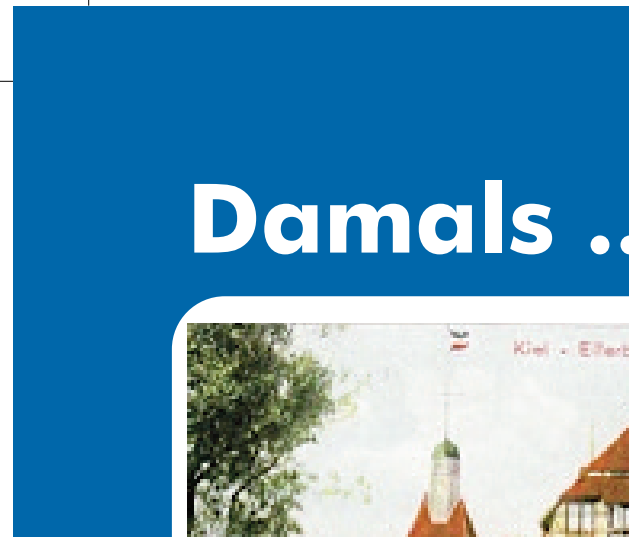
Abb. 1: Die Schnittmarken sind bitte wie im Beispiel oben (abgebildet ist die obere linke Ecke des PDFs) außerhalb der Beschnittzugabe zu platzieren, der Beschnitt beträgt für die Produktion in HPL umlaufend 10 mm.

Damals-SP-A4-1:Layout 1 13.09.2012 12:26